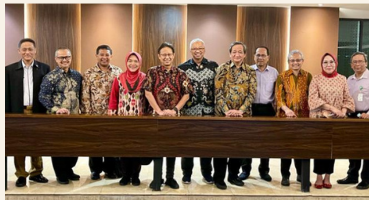
Gambar 1. Pertemuan Komite Bersama