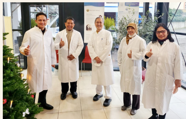
Gambar 3. Kunjungan Health Facility, Berlin