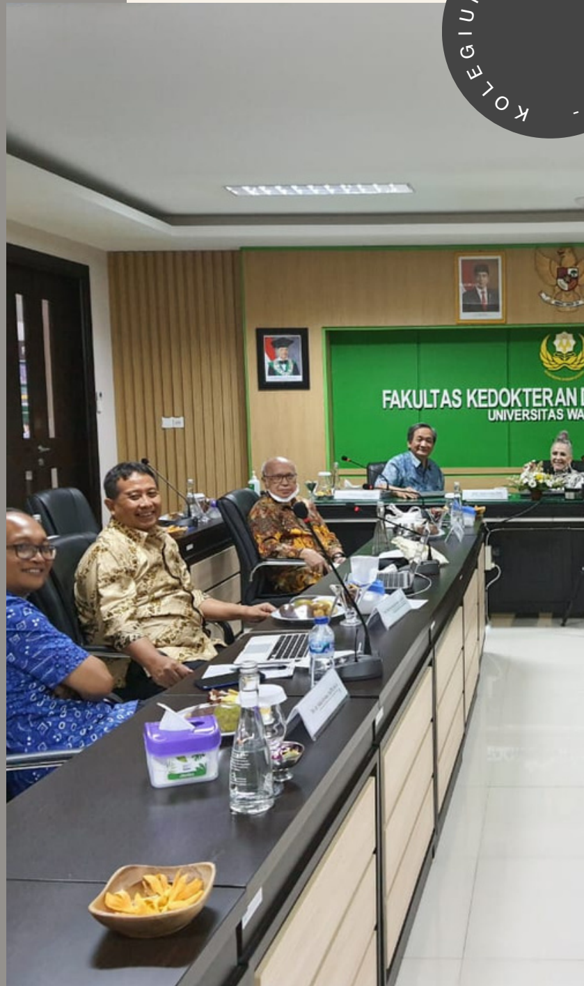
Gambar 2. Pertemuan di Universitas Warmadewa, Bali